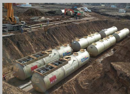
КОС ЭКО-Р-1000, ЖК "Цветы Башкирии", г. Уфа