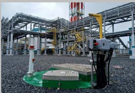
Производство и поставка 30-и комплектных КНС ПАО "СИБУР Холдинг" Западно- Сибирский Нефтехимический комбинат Г. Тобольск