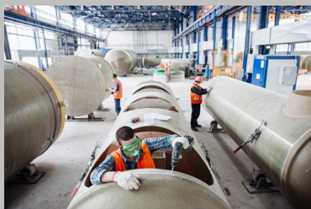
Производство г. Тольятти